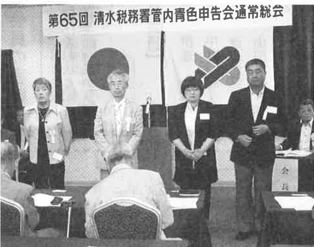
▲ 表彰を受けた優良会員